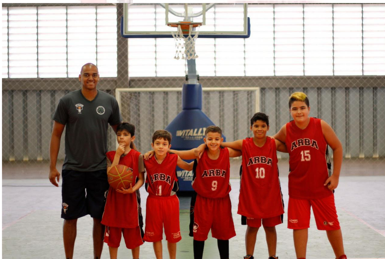
Participação dos atletas sub 11 masculino na Copa Monte Libano

Em outubro de 2021, tivemos a retorno dos campeonatos regionais de acordo com o Decreto Estadual, bem como decretos municipais.