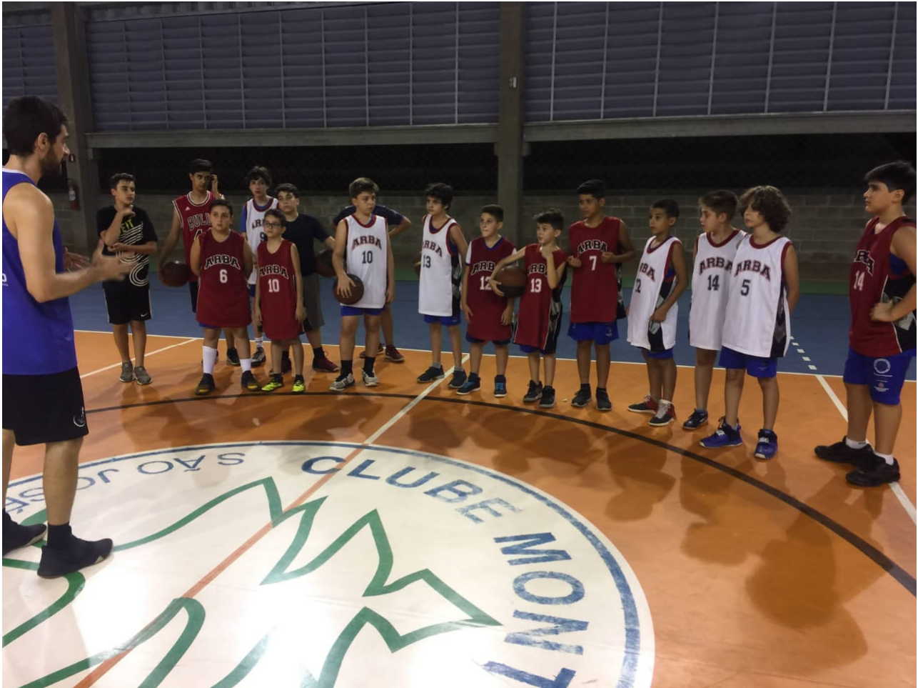
Treino da equipe sub 13 masculino para competições.

Av. Feliciano Salles Cunha, 2975 – Sala C – Jardim Novo Aeroporto, CEP 15035-000 São José do Rio Preto / SP – Fone: (17) 3218-8247 – CNPJ 04.310.336/0001-01