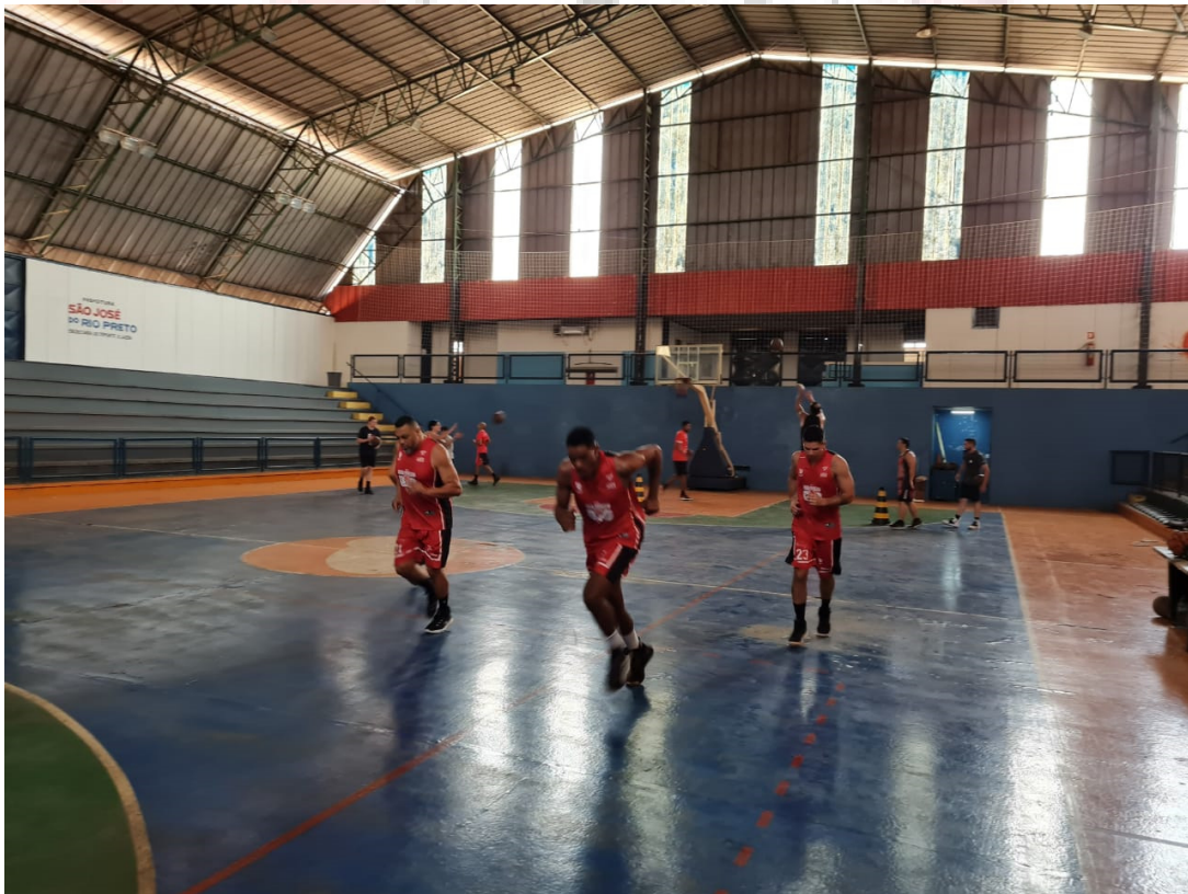
Treinamento da Equipe 3x3 Adulto Masculino para competições.