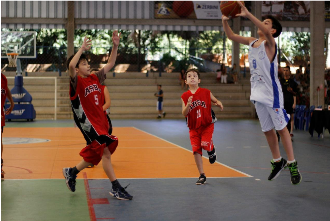
Participação dos atletas sub 11 masculino na Copa Monte Libano

Av. Feliciano Salles Cunha, 2975 – Sala C – Jardim Novo Aeroporto, CEP 15035-000 São José do Rio Preto / SP – Fone: (17) 3218-8247 – CNPJ 04.310.336/0001-01